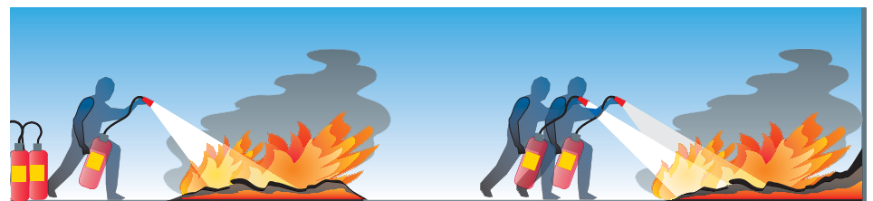
Nicht hintereinander löschen sondern mehrere Löscher gleichzeitig einsetzen