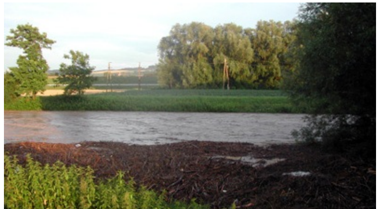
Bedrohlicher Anstieg der Perschling innerhalb kürzester Zeit am 06. Juli 2009

Nach einer großen Hochwasserschutz-Übung im April folgte dann nur Wochen später der Ernstfall, bei dem auch ein mobiler Hochwasserschutz im Bereich der Langer-Mühle aufgebaut wurde.