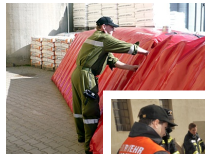
Aufbau eines mobilen Hochwasserschutzdammes aus Fertigelementen.

Am 4. April fand im Rahmen des Katastrophen-Hilfsdienstes im Bereich der Langer-Mühle in Atzenbrugg eine Großübung zum Thema "Hochwasserschutz, Dammsicherung und Objektschutz" statt. Die Übung wurde von der FF Atzenbrugg gemeinsam mit dem Bereitschaftskommando ausgearbeitet und diente auch zur Erprobung neuartiger mobiler Hochwasserschutz-Elemente in der Praxis. Insgesamt übten rund 260 Mann aus dem gesamten Bezirk Tulln.