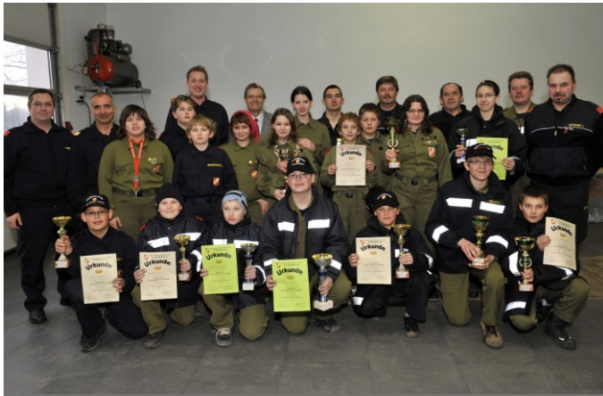
Die stolzen Sieger des Sportbewerbs mit ihren erkämpften Pokalen

Im März fanden sich 6 Feuerwehrgruppen aus dem Feuerwehrabschnitt Atzenbrugg zum Sportbewerb im Feuerwehrhaus Atzenbrugg zusammen. Dort mussten mehrere Stationen absolviert werden wie z. B. Russisches Kegeln, ein Crocket Parcours und einige mehr.