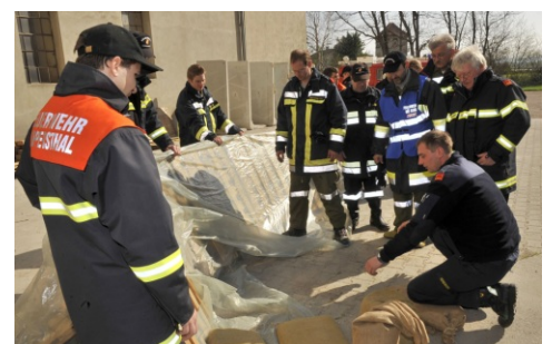
Herstellung eines Schutzdammes aus Paletten.