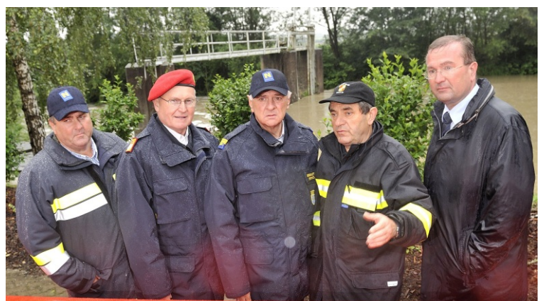
Vertreter von Gemeinde, Feuerwehr, Land und Bezirk beim Lokalaugenschein

Für den Einsatz der mobilen Schutzeinrichtungen interessierten sich auch hochrangige Funktionäre und Politiker.