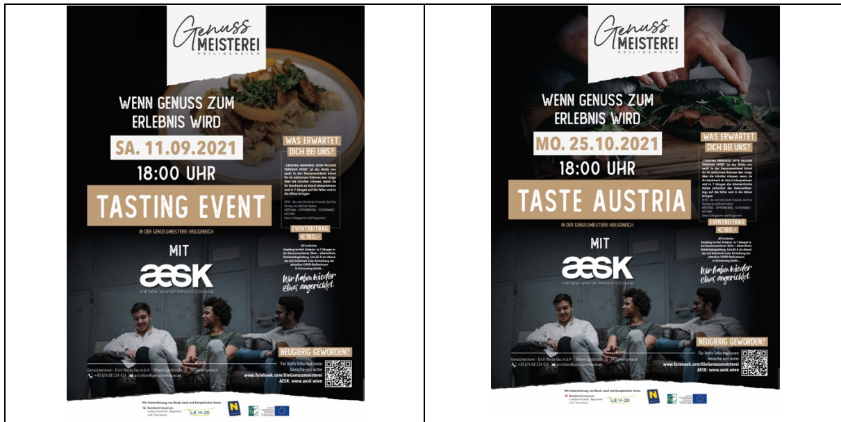
Plakate zu den Events

Fotocredit: © Genussmeisterei Heiligeneich; Abdruck: honorarfrei