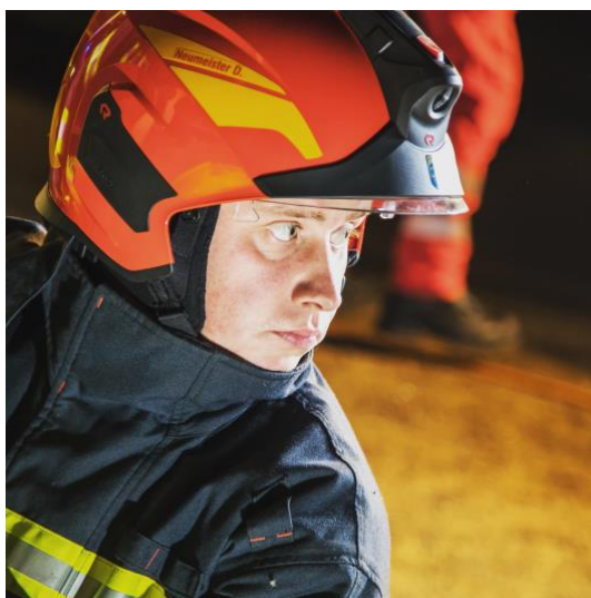
Foto: Gewinner-Posting der FF Wilfersdorf.