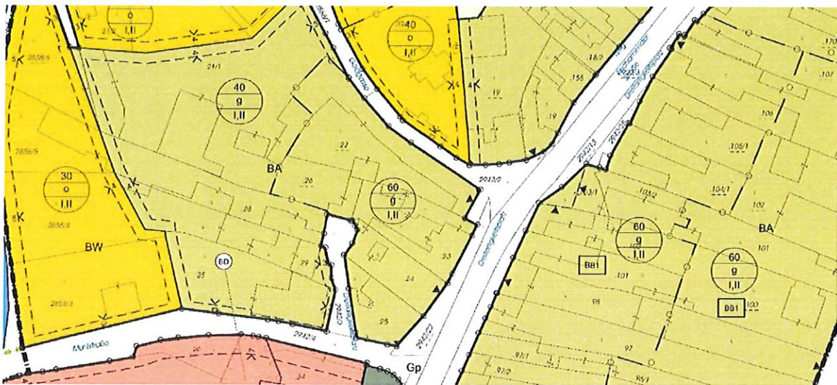
Planbeispiel Bebauungsplan; Auszug Bebauungsplan Enzersdorf a. d. Fischa, LAP-ZT GmbH

Im Textteil werden Bebauungsvorschriften für den Baulandbereich festgeschrieben. In der Plandarstellung werden die Inhalte des Bebauungsplanes durch entsprechende Signaturen dargestellt.