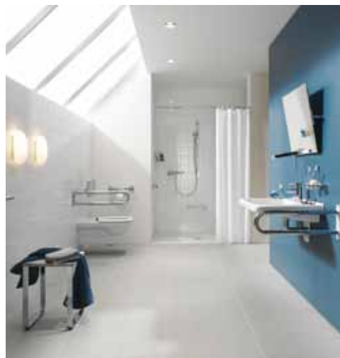
Barrierefreies Baddesign – von der Toilette bis zur Dusche alles stufenlos erreichbar