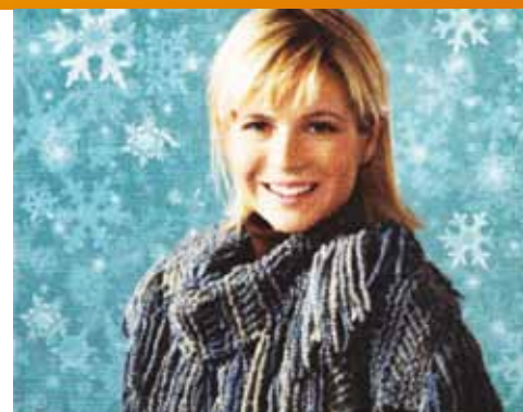
Trendiger Schal einfach zum Selberstricken