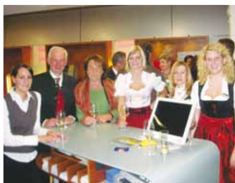
Persönliche Beratung und kulinarische Leckerbissen in der Raiffeisenkasse Loosdorf