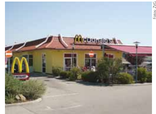
McDonald's direkt an der A1-Abfahrt Loosdorf vor (oben) und nach dem Umbau (links)