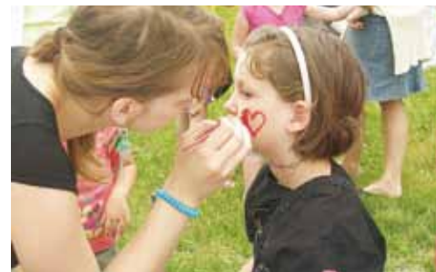
Der Spielbus besuchte die Kinderfreunde

Im September kam für unsere Kleinsten der Kasperl zu Besuch und im Oktober konnten sie sich beim Kürbisschnitzen auf Halloween einstimmen. Weiters findet man uns am Adventpfad, wo wir Kinderbetreuung am