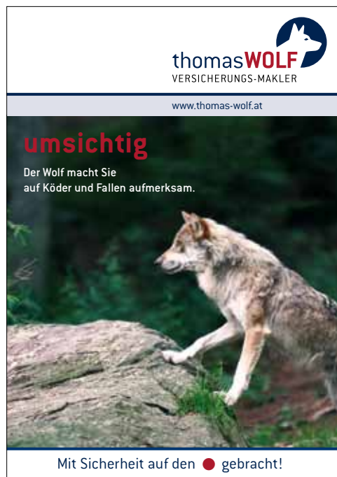
www.ljm.at