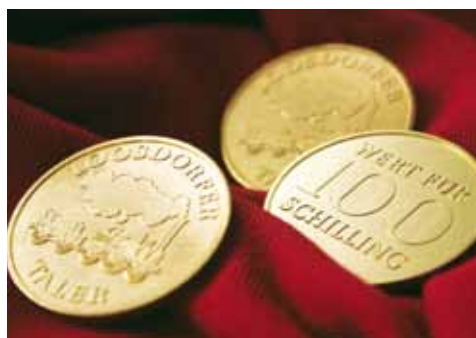
Der goldene Loosdorfer Taler kann bis 31. Dezember 2010, 12 Uhr, bei der Raiffeisenkasse Loosdorf getauscht werden.