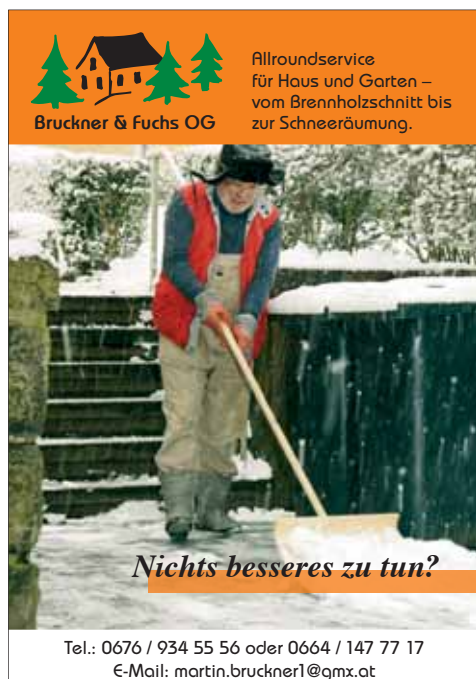
www.jimat, Foto: FOTOUIA

50 m 2 Wohnung mit Balkon, monatliche Betriebskosten: € 139,- exkl. Strom und Heizung; Verkaufspreis: € 48.000,- Kontakt: Tel. 0650/24 11 042