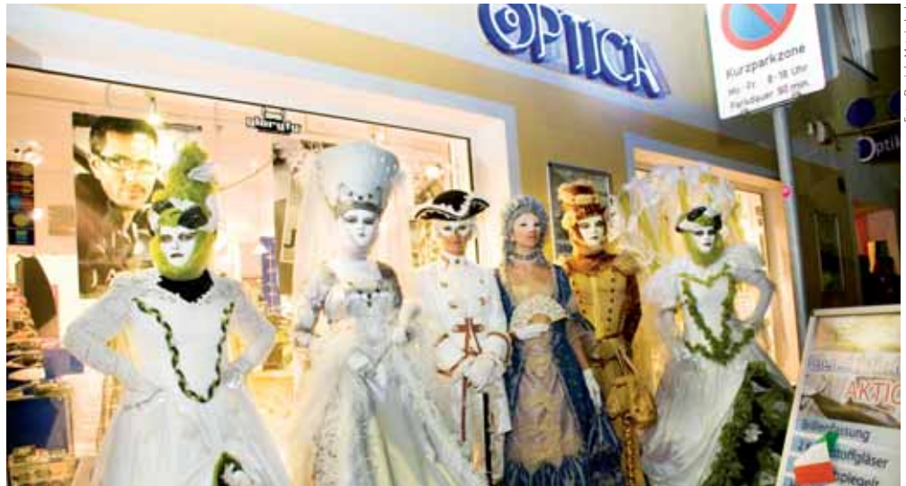
OPTICA bringt 12 Stunden Italien nach Loosdorf – diesem Motto folgten mehr als 500 Kunden, die sich im italienischen Ambiente von den neuesten Trends im Bereich der Brillenmode überzeugen konnten. Als Höhepunkt wurden venezianische Karnevalsmasken vorgeführt.

3382 Loosdorf Geränkefachhandel Linzer Straße 14 Tel./Fax 02754/6285