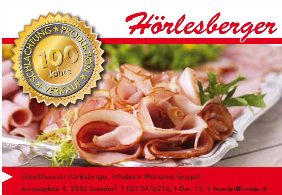
Anzeige | Foto: Fotocollage

Und: „Wir überlegen auch, im Herbst eine Aktion zu starten, um in besonderen Veranstaltungen vor allem Kindern und Jugendlichen klar zu machen, wie sie durch ihr Verhalten das Risiko eines Hundebisses minimieren oder ausschalten können. Es sind oft nur Kleinigkeiten, die, wenn sie nicht beachtet werden, zu unangenehmen oder gefährlichen Ergebnissen führen können“, so der Bürgermeister abschließend. ■