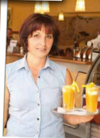
... das schmeckt :)))