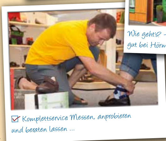
☑ Komplettservice Messen, anprobieren und beraten lassen ...