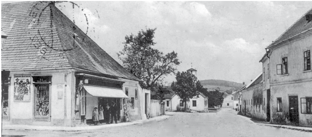
Gewinnspiel: Unter welchem Namen ist diese „Greißlerei“ (im Bild links) heute bekannt?

Die Gewinnspiel-Serie – Wie gut kennen Sie Loosdorf?