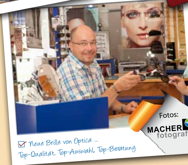
☑ Neue Brille von Optica ... Top-Qualität, Top-Auswahl, Top-Beratung

„Aber ich weiß doch schon, wie ich das kleine Brillenproblem löse. Ich erledige das bei der Firma Optica in Loosdorf. Da hab ich ein breit gefächertes Angebot, gute Beratung und tollen Service.“