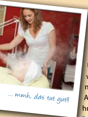
... mmh, das tut gut!!