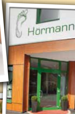
Wie geht's? – Natürlich gut bei Hörmann!