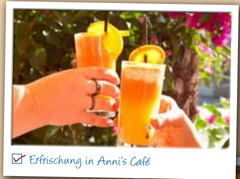
☑ Erfrischung in Anni's Café

„Aber ich weiß doch schon, wie ich das kleine Brillenproblem löse. Ich erledige das bei der Firma Optica in Loosdorf. Da hab ich ein breit gefächertes Angebot, gute Beratung und tollen Service.“