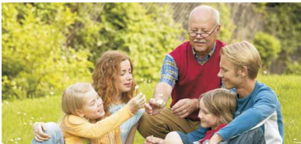
Eine gut durchdachte Vorsorge betrifft wesentlich mehr als nur eine Person.