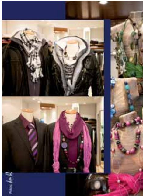
Die neuen Herbsttrends machen Lust auf Mode.

Die Röhren-Jeans bleiben – die weiten Hosen sind wieder im kommen. Katie Holmes hat die Boyfriend-Jeans salonfähig gemacht und auch die hohen und recht weiten Marlenehosen sind auf dem Vormarsch.