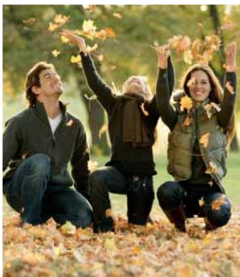
Empfangen Sie den Herbst mit einem Lächeln und nehmen Sie das Serviceangebot der Bruckner & Fuchs OG in Anspruch.

Aber auch der Garten braucht gerade in dieser Jahreszeit viel Pflege, und vor allem Zeit. Alle Arbeiten, die bereits im Herbst ordnungsgemäß erledigt werden, ermöglichen im Frühling einen rascheren Start der Gartensaison. Die Bruckner & Fuchs OG nimmt Ihnen diese Tätigkeiten ab und schenkt Ihnen mehr Ruhe in Ihrer Freizeit. Gärtnerarbeiten, vom Laubrechen bis zum Heckschnitt und der richtigen Überwinterung Ihrer Lieblingpflanzen – all das ist im Serviceangebot enthalten.