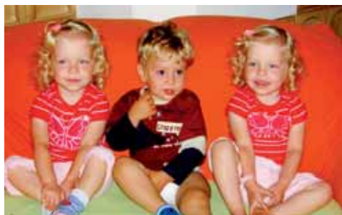
Gerade bei Mehrlingskindern ist es oft schwierig die passenden Sachen, wie Kinderwagen zu finden – der Flohmarkt kann dabei helfen.

Oftmals ist es für „frischgebackene“ oder werdende Eltern finanziell nicht leicht, das Richtige für ihren Schützling zu kaufen, gerade bei Mehrlingsgeburten, darum findet am Samstag, dem 19. September zwischen 13.00 und 17.00 Uhr ein Baby-, Kinder- und Mehrlingsbazar in der Losensteinhalle in Loosdorf statt. Mitmachen kann jeder, der seine nicht mehr benötigten Kindersachen verkaufen will. Weitere Auskünfte bezüglich der