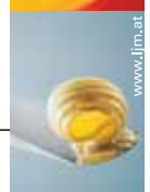
www.jfm.at, Foto: FOTOLIA