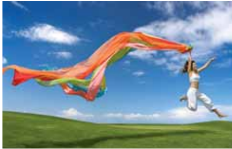
Energetische Störungen werden beseitigt.