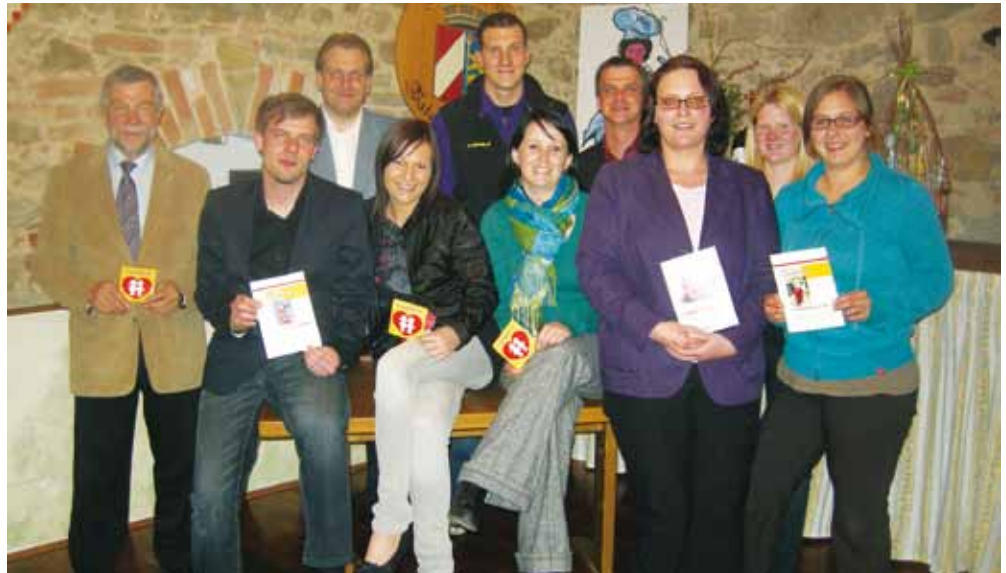
Der Gründungsvorstand der Kinderfreunde Loosdorf mit Bürgermeister Joschi Jahrmann

Um auch möglichst viele unserer Ideen noch in diesem Jahr umsetzen zu können, begannen wir bereits am 28. April 2010 mit dem ersten Spielenachmittag im Clubraum der Losensteinhalle. An diesem Nachmittag