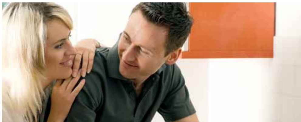
Kochen in einer Feng Shui Küche macht mehr Freude und sorgt für Ausgeglichenheit.

Die Küche ist der wichtigste Raum im Haus. Hier passiert die Umwandlung von Rohstoffen und Nahrungsmitteln in wohl-schmeckende Speisen.