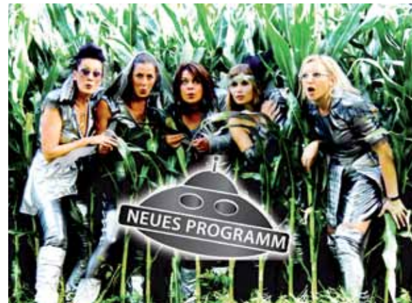
Die NeoBrennDirndl sind auch heuer wieder in Loosdorf zu Gast.