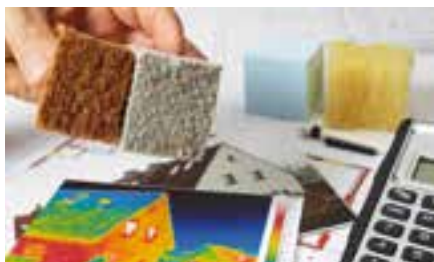
Wohlfühlen in den eigenen vier Wänden