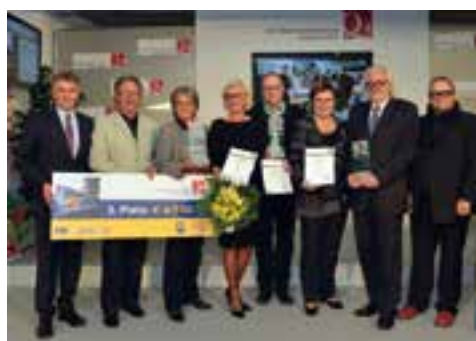
Preisverleihung bei der Abschlussveranstaltung des Niederösterreichischen Baupreises

Umsichtig und unter Berücksichtigung des alten Baumbestandes, steht das Gebäude in einem spannenden Bezug zu seiner Umgebung. Auf wenige Materialien reduziert präsentieren sich die beiden funktional gegliederten Baukörper, zueinander leicht verschwenkt und mit einem gläsernen Gang verbunden, in einem geschmackvollen