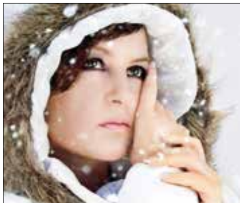
Trockene Luft und reduzierte Hautfettproduktion im Winter sind Stress für die Haut

Wollwachs, natürlich und biologisch hergestellt, hilft der Haut sich selbst zu helfen. In Verbindung mit wertvollen Ölen und Blütenessenzen wirkt es regenerierend und schützt wunderbar vor Austrocknung und Kälte.