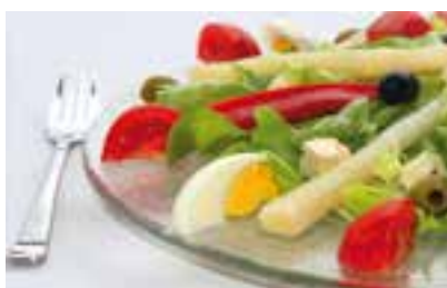
Margot Keisler / pixelnode

für Anfänger und fortgeschrittene Vegetarier. Auch die Vegane Küche wird vorgestellt und in die Praxis umgesetzt.