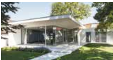
Nö. Baupreis für Einfamilienhaus in Loosdorf