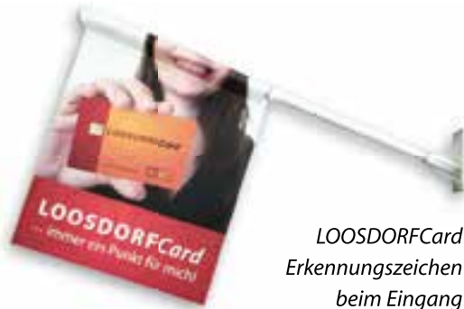
LOOSDORFCard Erkennungszeichen beim Eingang

Mit der LOOSDORFCard punkten Sie in 22 Geschäften und Betrieben. Für jeden Einkauf bei einem Partnerbetrieb, egal ob im Handel, bei einem Gastwirt, bei einem Dienstleistungs- oder Handwerksbetrieb, sammeln Sie Bonuspunkte, die Ihnen bei einem der nächsten Einkäufe bares Geld sparen, wenn Sie die Punkte wieder einlösen.