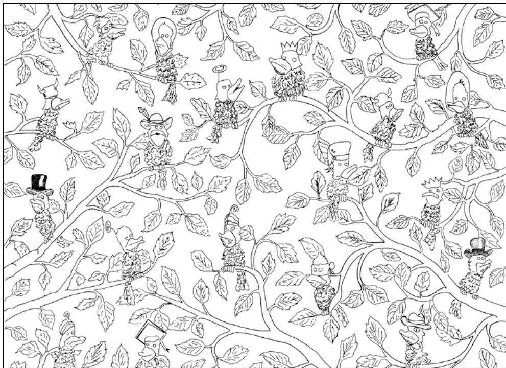
Such- und Ausmalbild: Vergleiche die Hüte. Welcher der Raben hat keinen Doppelgänger?

Hinweis: Tabellen für andere Größen und Hilfestellung bei Fragen erhalten Sie kostenlos bei Fa. Alfery in Loosdorf. ■