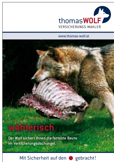
Jim Werbegenieur | Fotos: Fotolia.de

Bücherei Loosdorf Europaplatz 11, 3382 Loosdorf T 02754 6384 20, www.loosdorf.bvoe.at