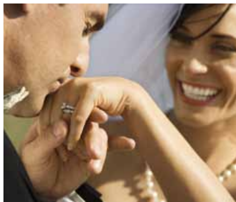
MakeUp für den Bräutigam gehört schon der Hochzeitsfotos wegen zum perfekten Fest.

Ja, sie haben vorhin richtig gelesen, auch der Bräutigam kann für diesen besonderen Tag an ein Make Up denken. Denn wie toll sieht es aus, wenn am Hochzeitsfoto der Bräutigam mehr glänzt als die Braut? Also trauen Sie sich! Wenn Sie wünschen, komme ich auch zu Ihnen nach Hause. – Ich freue mich auf Ihren Anruf. ■