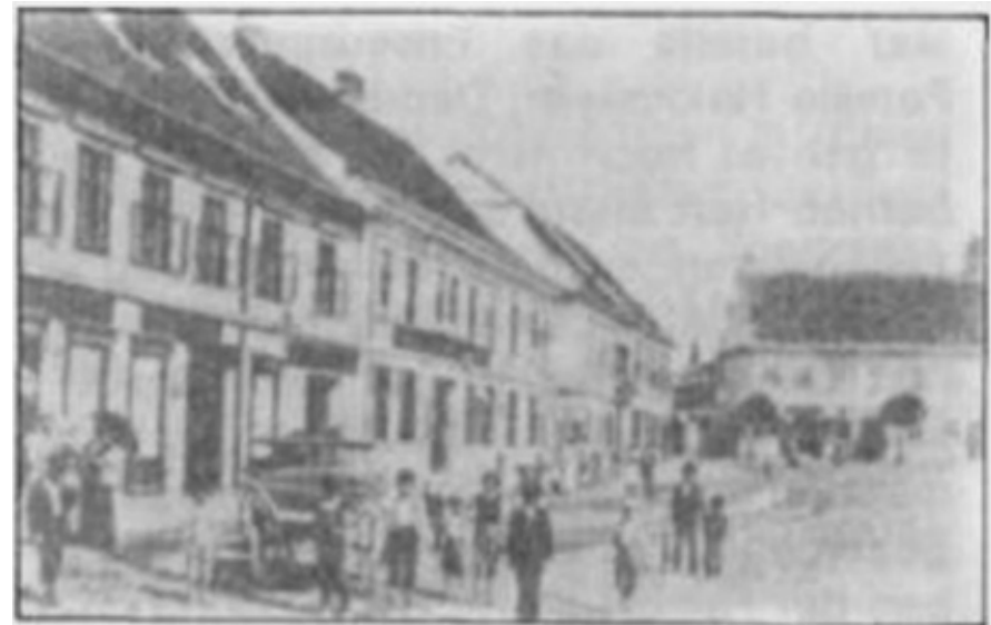
Hauptplatz West um 1900

1960: Lebensmittelgeschäft Krippel-Viehhauser