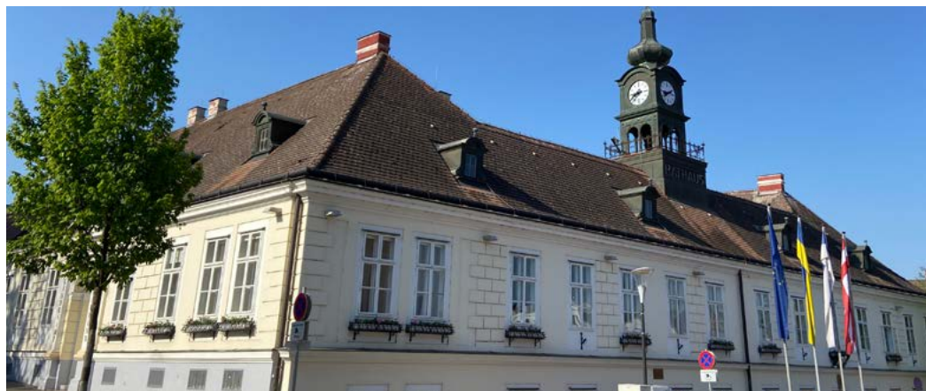
Rathaus der Stadt Hollabrunn.

serentsorgung sind verantwortlich, dass alle Haushalte mit Wasser versorgt und die Abwässer ordnungsgemäß entsorgt werden. Eine besondere Abteilung ist auch die Grünraumpflege, die in den vergangenen Jahren immer