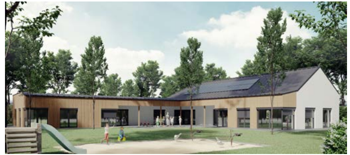
Rendering des fertigen Kindergartens (erstellt von VOLART)

Standort im Enzersdorf i. Th. kann so erhalten bleiben. Durch den Neubau entsteht ein zweigruppiger Kindergarten mit einem vergrößerten Gartenbereich und endlich auch einem Bewegungsraum. Der eingeschossige L-förmige Baukörper wird in Massivbauweise errichtet, große Glasfenster und -türen bringen viel Licht in die