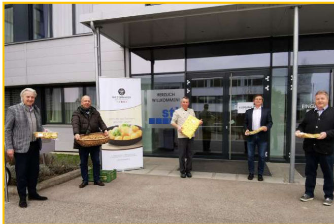
Lebensmittel in Bio-Qualität haben einen hohen Stellenwert im Hollabrunner Studentenheim.