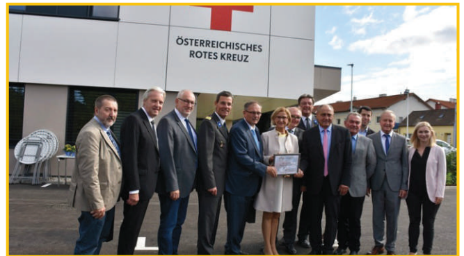
„Ehrenamtliches Engagement ist von unschätzbarem Wert“, betonte LH Mikl-Leitner bei der Eröffnung.