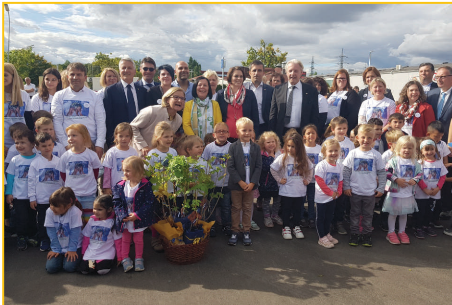
Ausgelassene Stimmung herrschte bei der Eröffnungsfeier der neuen Kindergärten bei Jung und Alt.

140 Kindern begrüßten Landeshauptfrau Johanna Mikl-Leitner mit Gesang und einem selbst einstudierten Tanz.