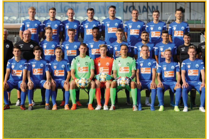
Bild: aktueller Kader für die Saison 2019/20

Nächster Tag der offenen Tür in Zusammenarbeit mit der HTL Hollabrunn: am 22. November 2019 von 13 bis 17 Uhr und am 23. November 2019 von 8:30 bis