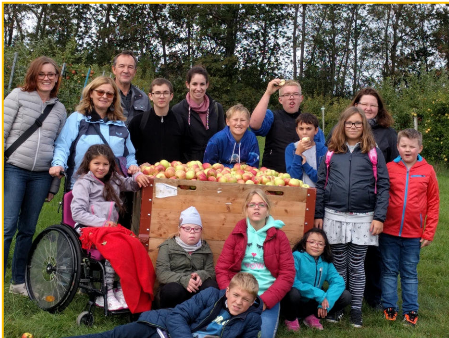
Die LFS Hollabrunn ist bekannt für ihre Offenheit und die Vielfalt ihrer Angebote.