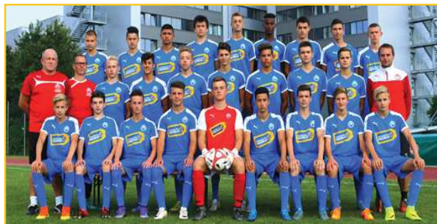
Die NÖ Landesmeister Mannschaft U 17 vom SV Horn vor dem Sport- und Seminarhotel und Sportinternat

Auch im Sport- und Seminarhotel hat man gute Ergebnisse erlangt. Die Auslastung ist von Jänner bis Mai im Durchschnitt um 31,47% gestiegen und im April gab es sogar +75,47%. Im August ist das Sport- und Seminarhotel, dem in den Sommerferien auch der Internatsteil zur Verfügung steht, bereits fast ausgebucht. Diverse Projektwochen und Sommerseminare, wie auch Reisegruppen finden sich hier im Sommer ein, da das Hotel eines der wenigen hier in der Gegend ist, wo auch große Gruppen einen Platz finden und zusätzlich noch die Sportanlagen beim, und Seminarräume im Haus nutzen können.