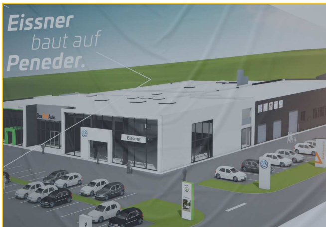
So soll das Autohaus nach der Fertigstellung aussehen.

Geschäftsführer Eissner war sichtlich gerührt über diesen großen Schritt in Richtung Zukunft seines Autohauses. Nach der Begrüßung der Ehrengäste sprach er vom bereits vorhandenen Autohaus in der Stadt, das nicht nur in die Jahre gekommen ist, sondern auch nicht mehr den nötigen Platz bietet. Am neuen Standort soll nun einerseits ein klassisches Autohaus, und andererseits ein moderner und zukunftsweisender Betrieb mit Fokus auf Nachhaltigkeit (E-Mobilität, Photovoltaikanlagen etc.) entstehen. Beim Bau werden zu 100%