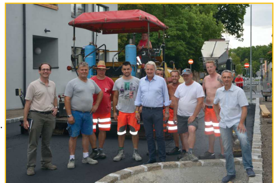
Dank vieler fleißiger Hände, erfolgte die Verkehrsfreigabe rasch

Die Straßenbauarbeiten sind abgeschlossen, sodass seit 14. Juni 2017 beide Straßenzüge wieder für den Verkehr zur Verfügung stehen. Restarbeiten werden noch in nächster Zeit durchgeführt. Insgesamt wurden 610 m Straßenlänge um € 760.000 erneuert.