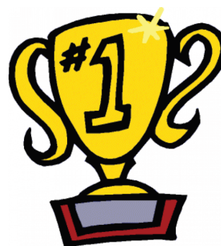
So sehen Sieger aus! Die Freude unter den Erstplatzierten war verständlicherweise groß!