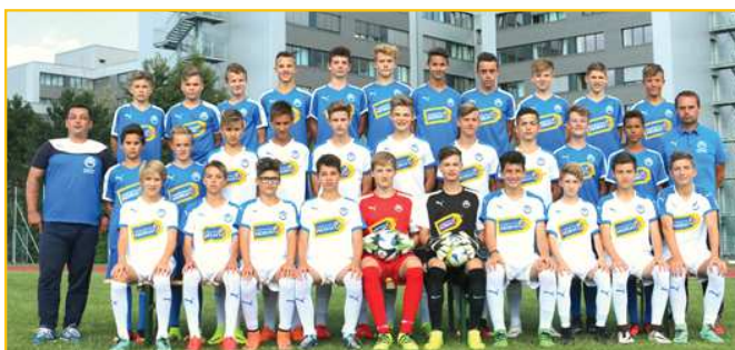
Die NÖ Landesmeister Mannschaft U 15 vom SV Horn vor dem Sport- und Seminarhotel und Sportinternat

Die Ergebnisse sind dank des harten Trainings der Mannschaften und der Unterstützung der tollen Fangemeinde